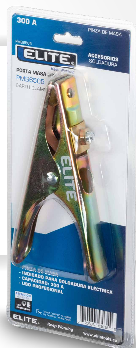
Tipo empaque: blister